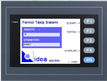
Operatör Paneli Ana Ekran